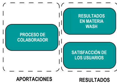
Figura 1. Monitorización de las perspectivas

El marco incluye indicadores que miden la calidad y la rendición de cuentas desde tres perspectivas: